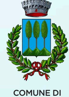
COMUNE DI LORO CIUFFENNA