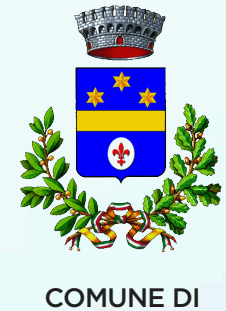
COMUNE DI CAVRIGLIA