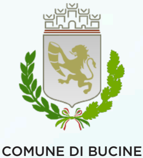
COMUNE DI BUCINE