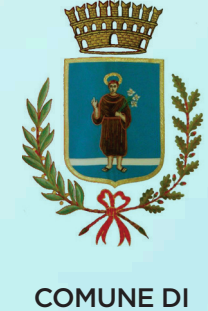
COMUNE DI TERRANUOVA BRACCIOLINI