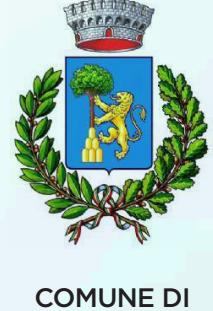
COMUNE DI LATERINA