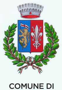
COMUNE DI CASTELFRANCO-PIANDISCO